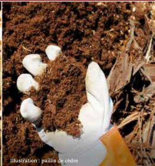
Illustration : paillis de cèdre